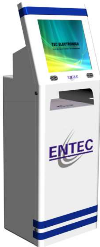
Mod. L5S con monitor touch screen e impresión láser.