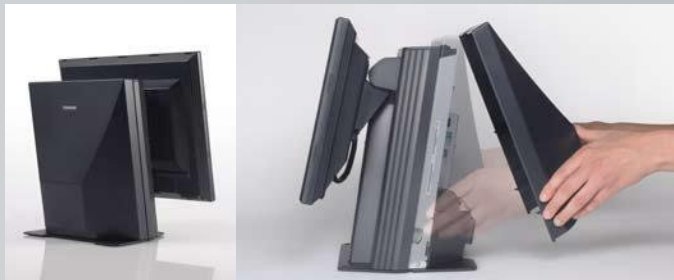
TPV premiada por su diseño.

La premiada ST-A10 posee una huella ultra-reducida que engloba un amplio abanico de funcionalidades, ofreciendo un mantenimiento más sencillo con fácil acceso a sus módulos internos y componentes mediante clicks. Su diseño inteligente asegura rapidez en la atención al cliente.