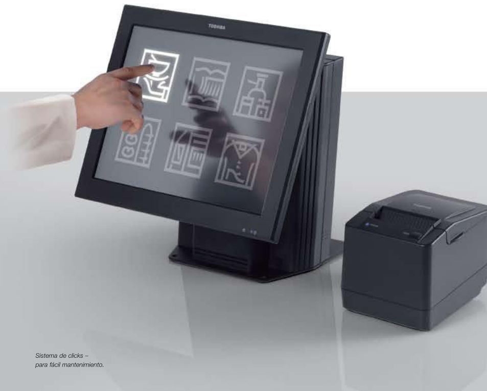
Sistema de clicks - para fácil mantenimiento.