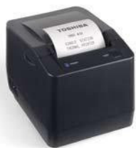
Combine la ST-A10 con la impresora de doble cara TRST-A15 para ahorrar hasta un 45% en rollos de papel.